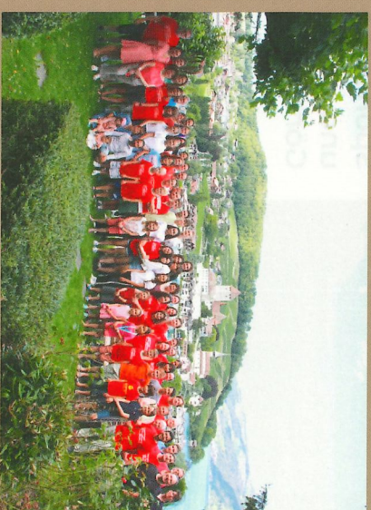
Teilnehmer Goppisberg Musikfestival 2023